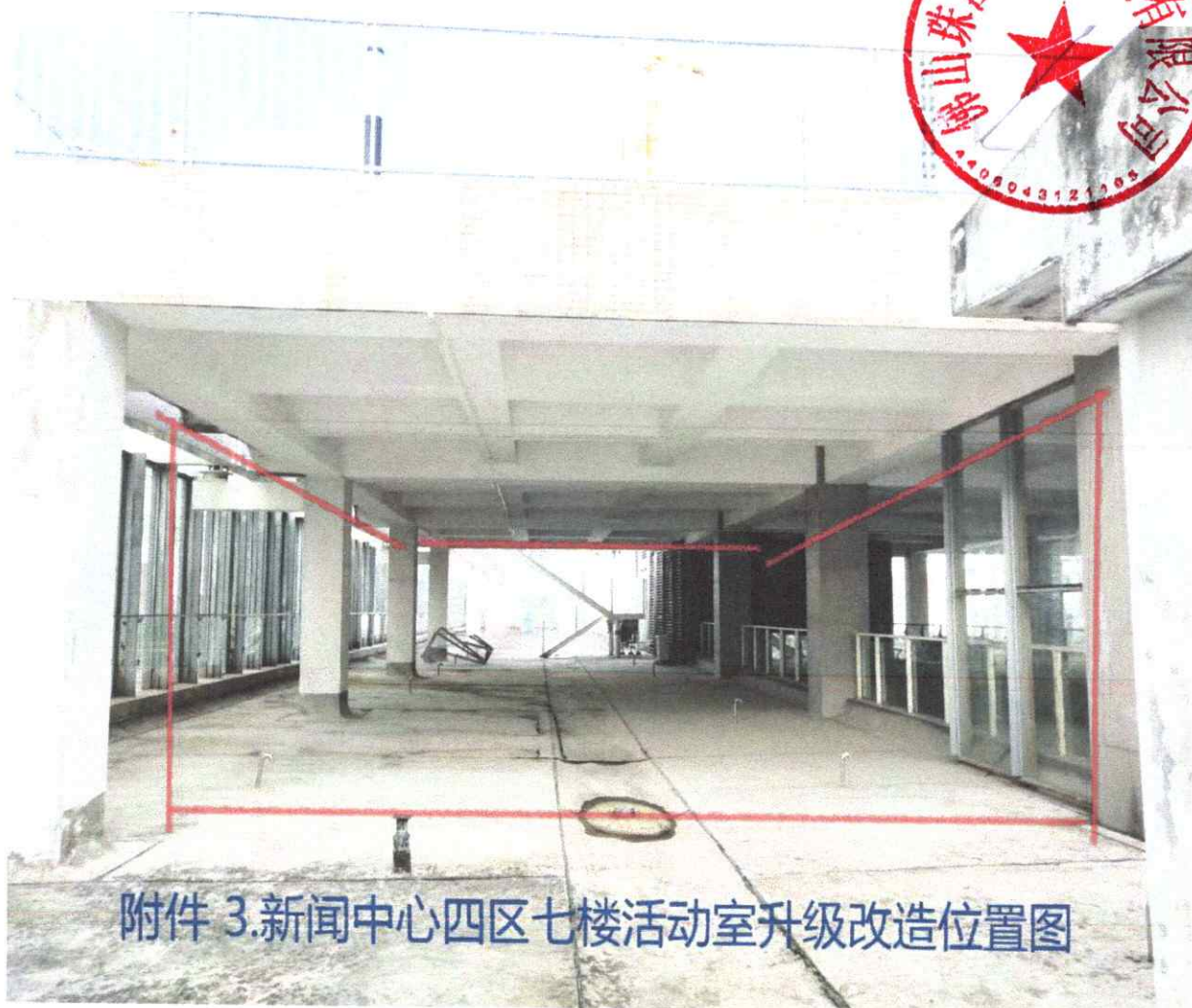
附件 3.新闻中心四区七楼活动室升级改造位置图